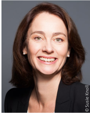
DR. KATARINA BARLEY (47) ist SPD-Generalsekretärin und Mitglied des Deutschen Bundestages.