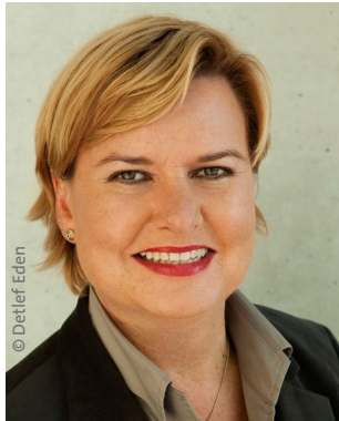
DR. EVA HÖGL (47) ist Mitglied des Deutschen Bundestages und stellvertretende Vorsitzende der SPD-Bundestagsfraktion