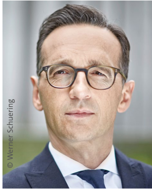
HEIKO MAAS (50) ist Bundesminister der Justiz und für Verbraucherschutz und Vorsitzender der SPD Saar.