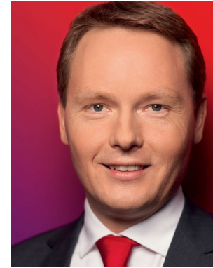
CHRISTIAN FLISEK (42) ist Mitglied des Deutschen Bundestags und Obmann der SPD-Bundestagsfraktion im NSA-Untersuchungsausschuss.

Aufgabe der SPD ist es, die berechtigten Fragen der Bürger, wie Freiheit und Sicherheit gewährleistet werden, besonnen und effektiv anzugehen. Schrille Panikmache verunsichert die Bürger und nützt damit nur den rechtsradikalen Parteien. In diesem Sinne wird sich die SPD-Fraktion weiter für einen starken Rechtsstaat einsetzen, der gleichzeitig die bürgerlichen Freiheitsrechte achtet und die Sicherheit der Bürgerinnen und Bürger gewährleistet. ■