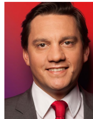
DR. JOHANNES FECHNER (43) ist rechts- und verbraucherpolitischer Sprecher der SPD-Bundestagsfraktion und Kreisvorsitzender der SPD Emmendingen.

Zusammenfassend lässt sich über jedes der drei Gesetze sagen: Es hat sich gelohnt, so lange zu verhandeln. Zu einem modernen Verständnis von Selbstbestimmung gehört ein zeitgemäßer Schutz vor Ausbeutung und sexueller Gewalt. ■